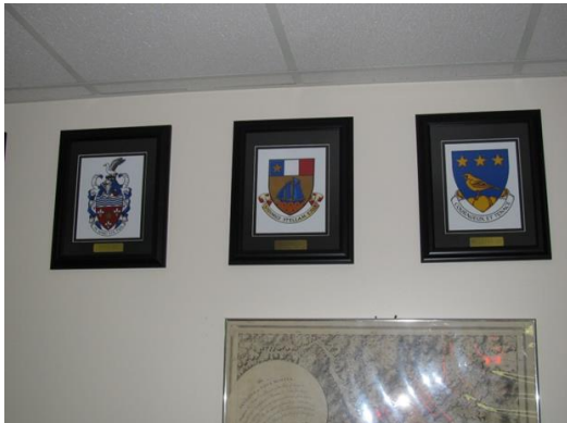
Quelques-une des photo des armoiries Celle des Richard au centre.