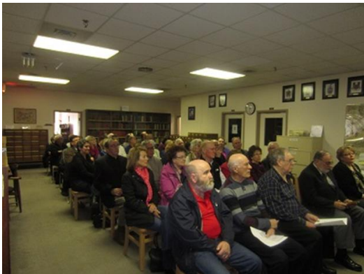
Plusieurs membres de la Fafa ont assisté au dévoilement

Le 11 avril dernier, une cérémonie a eu lieu au Centre d'Études Acadiennes où 4 familles (les Hébert, Lejeune, Maillet et Thibodeau) ont dévoilé une réplique de leurs nouvelles armoiries. Celles-ci s'ajoutent aux 14 autres, dont celles des Richard remises lors d'une cérémonie semblable en 2010.