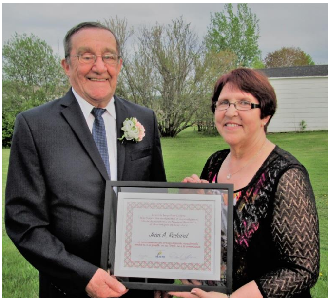
Prix de mérite

On a à cette occasion souligné les nombreux organismes dont il a fait partie et où il continue encore de collaborer.